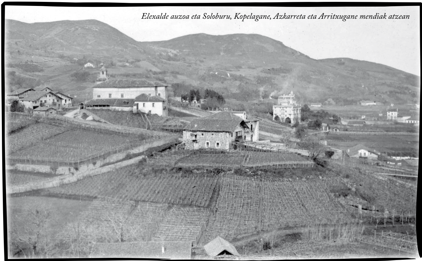
Elexalde auzoa eta Soloburu, Kopelagane, Azkarreta eta Arritxugane mendiak atzean

Bakio k udatiar geiago daukoz bertako erritarak baino. Azken oneek ia geienak iges egin dabe. Geienak separatistak ziran. Areek, baia, bederatziz