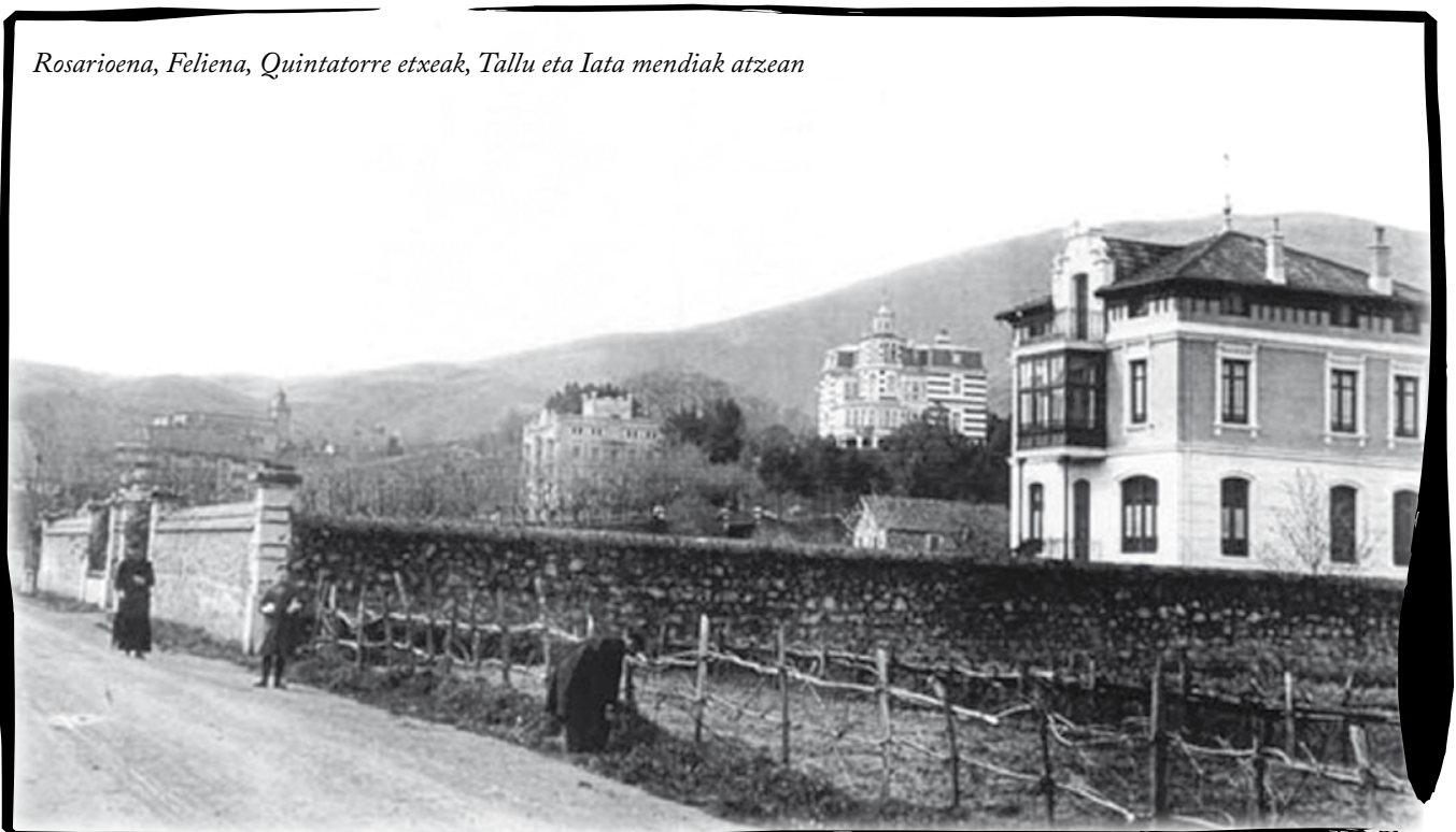
Rosarioena, Felieta, Quintatorre etxeak, Tallu eta Iata mendiak atzean

ebezan. Gorriak lau kainoidun itsasaldeko bateria bat eta beronentzako munizino ugari itxi ebezan atzean. Ilabete batzuk leenago imini ebezan bertan. TRUBIA izeneko etxeak 1890. urtean egindakoak ziran. Falangistak Bakion sartu ziran eta Iata mendian gora egiten asi ziran. Bakio biztanle batzuk guda mutil falangisteri ondo etorria egin eutseen. Bakion eskoitar errefuxiatu asko egoan. Bakion barrena baitailoi gorriak, au da, ITXASALDE, MEABE eta SAN ANDRES eta diziplinarioetariko bat, atzera egin eben, maiatzaren 8ko gauera artean egon ziran errian bertan. Zapatu gauean Iatamendiko jaigon lekuetara igan eben. Bakio udalak zortzi egun leenago egin eban anka errotik, Zalla errian barrian udala eratuteko. Erri funtzionario guztiak bertara eroan ebezan. Ez zan errian euretariako bape lotu. Argi-indarra kenduta egoan. Bakion egozan errefuxiatuen artean abadeak eta beste eleizgizon batzuk be baegozan. Bilbotik ospa eginda, bertan ostendu ziran, CNTkoen bildur, aurki. Bakion etxe guztiak oso-osorik egozan. Tiro otsak birritan baino ez ziran entzun ordurate, eta eurok aurreko astean, atan be. Donostiatik iges egindako batzuk Bakion euki eben gordelekua, komentu baten, euki be. Egia esanda, Bakion ez zan egon goseterik. Esnerik eta arrautzarik ugari baegoan etxaldeetan, osterara, ez egoan ogirik, ez oriorik, ez eta bear-bearrezko ziran bestelango jakirik. Areatzearen ondoan baegoan