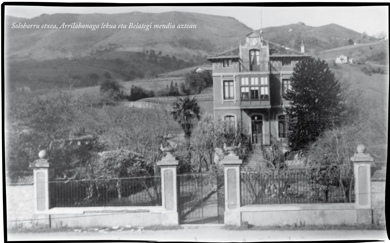
Solobarru etxea, Arrilabanaga lekua eta Belategi mendia aztean

kooperatiba eran abertzale ospetsuak egindako bizitzetako etxe bat.